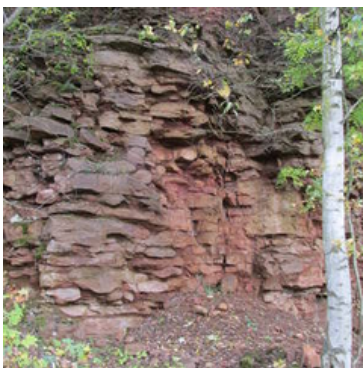
Afloramiento de mineral de hierro tipo "Minette"

La sonda utilizada también proporciona registro gamma natural (rayos gamma).